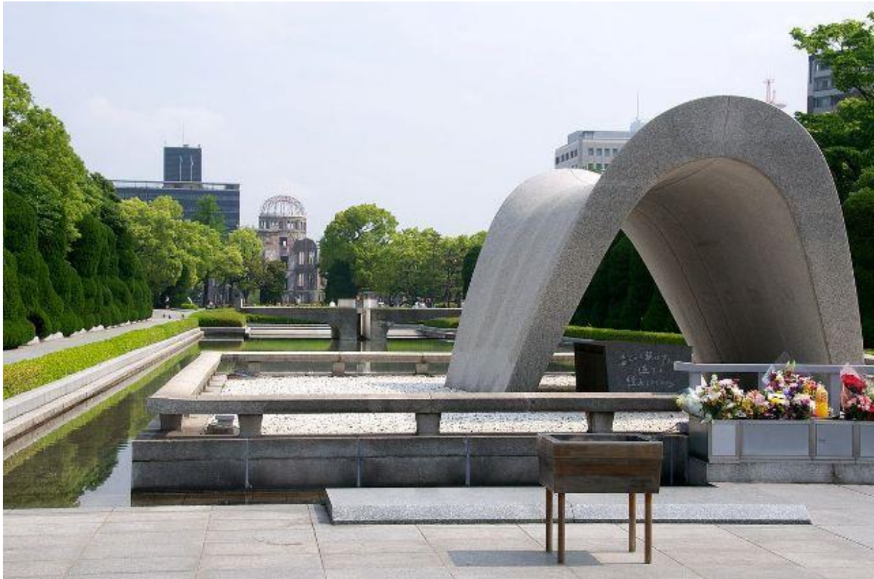
Hiroshima Peace Memorial Park