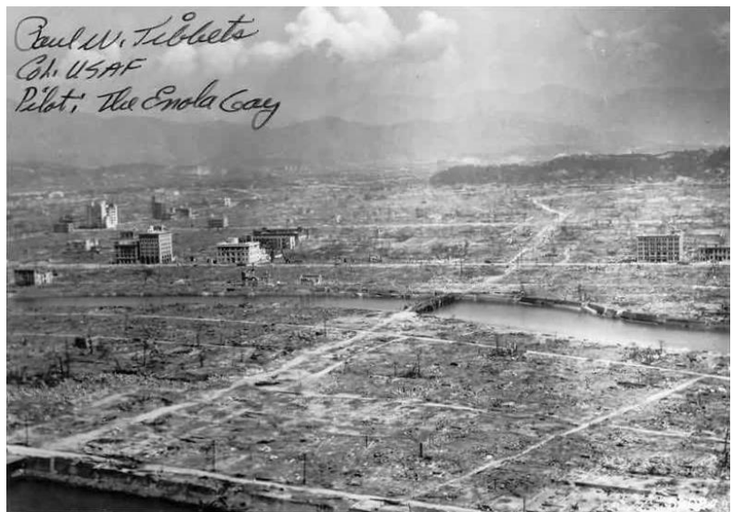
Hiroshima aftermath

그 중에서도 제 마음에 다가온 것은 카와모토 쇼우조우 씨의 체험담이었다. 가와모토 씨는 원폭투하부터 3 일 후에 부모를 찾아서 피난처에서 히로시마 시내에 돌아왔을 때 자신이 ‘원폭 고아’가 되어 버린 것을 알았다. 피난처 사원에서 약간의 식사를 받고 있지만 당시 11 세 성장기의 카와모토 씨의 굶주림을 만족시킬 수 없었다.