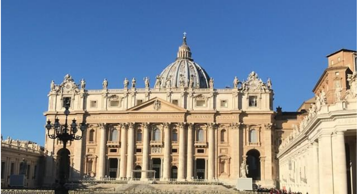
Sain Peter's Basilica