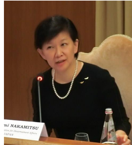
Izumi Nakamitsu 資料：Katsuhiko Asagiri | IDN-INPS

“因此，我们根本没有放弃对核裁军的努力，恰恰相反，正因为现状尤为艰难，各方就核裁军问题的商谈才显得尤为重要。”她补充说。（10.10.2017）INPS Japan/ IDN-InDepth News