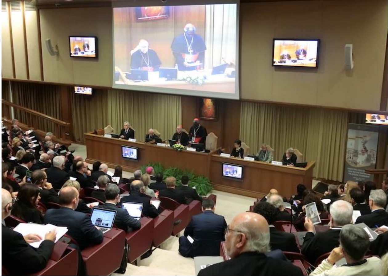
Cardinal Peter Turkson of Ghana welcoming Vatican conference participants on November 10.