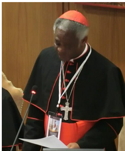
Cardinal Peter Turkson

此次会议举办的时间也十分特殊。Cardinal Turkson 继续说，“我们很担心另一次潜在的全球性灾难的到来。这样的担心已经上升到了一个新的高度，这是人类历史上自上次古巴导